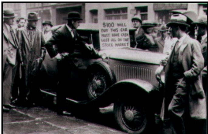
Automóvel sendo vendido a U$ 100,00 durante os anos 20 na Alemanha.