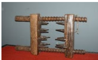
ESMAGADOR DE JOELHOS