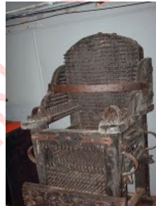
CADEIRA DE PREGOS