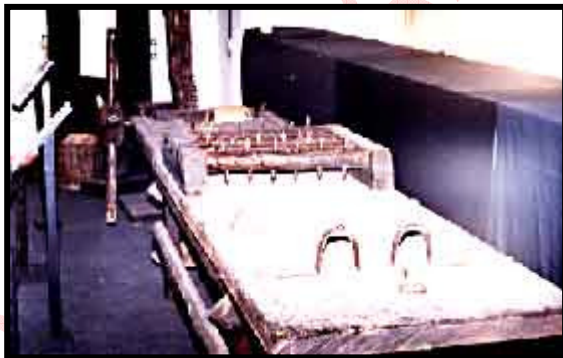
MESA DE ESTICAMENTO