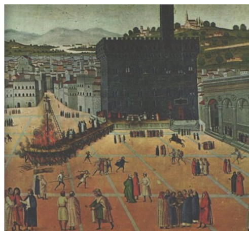
AUTO DA FÉ