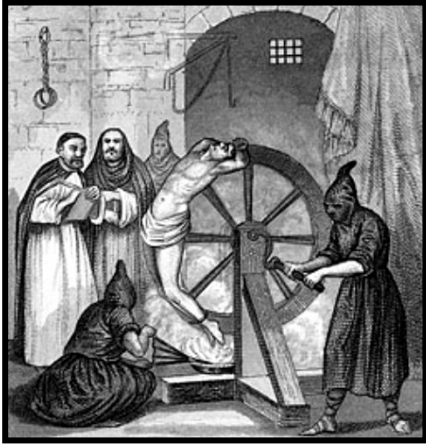
RODA DE DESPEDAÇAMENTO