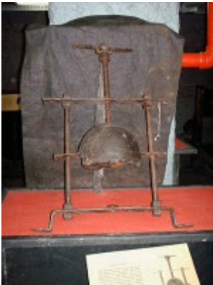
ESMAGADOR DE CRÂNIOS